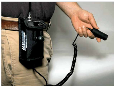
Funda para UP 201