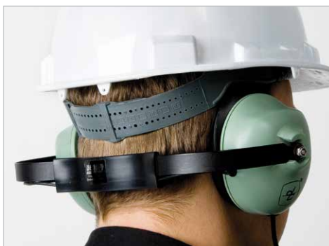
Auriculares para utilización con casco de seguridad