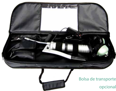
Bolsa de transporte opcional