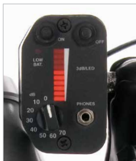
Gráfico de barras LED y selector de sensibilidad